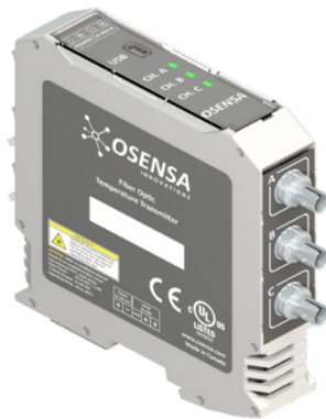
FTX-300-LUX+HT Transmetteur de Température